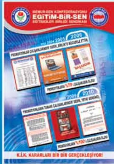
Mücadelemiz Sonuç Verdi; Promosyonların Tamamı Çalışanların