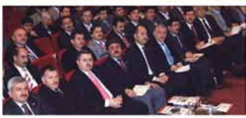
16. Başkanlar Kurulu Toplantısı Ankara'da Yapıldı