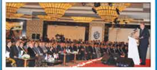
Memur-Sen'den Muhteşem Demokrasi Buluşması