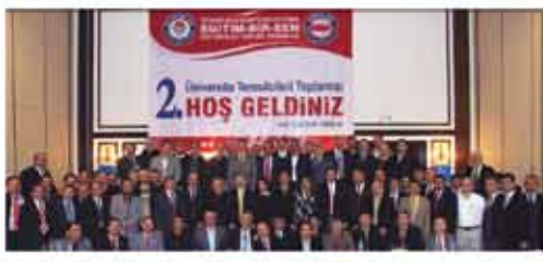
Özlük Haklarının Geliştirilmesi Mücadelesiyle Akademik Çalışmaları Birlikte Yürüten Tek Sendikayız