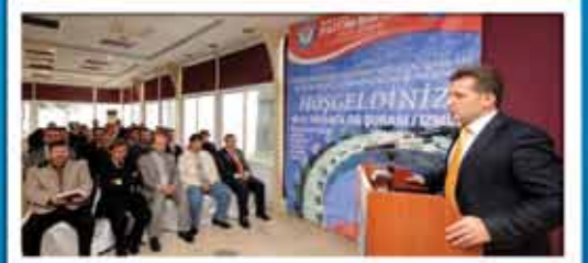
Bölge Şûra Çalışmaları Tamamlandı